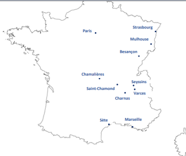
DÉPLACEMENTS DU CLUB EN CHAMPIONNAT - SAISON 2022-2023